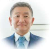
株式会社One to One福祉教育学院 代表取締役 埼玉医科大学 客員教授