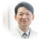
埼玉医科大学 副医学部長