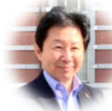
株式会社One to One福祉教育学院 講師育成指導部長 元老人福祉施設 施設長